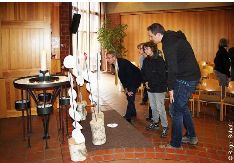
Wünsche und Visionen aus der Gemeinde